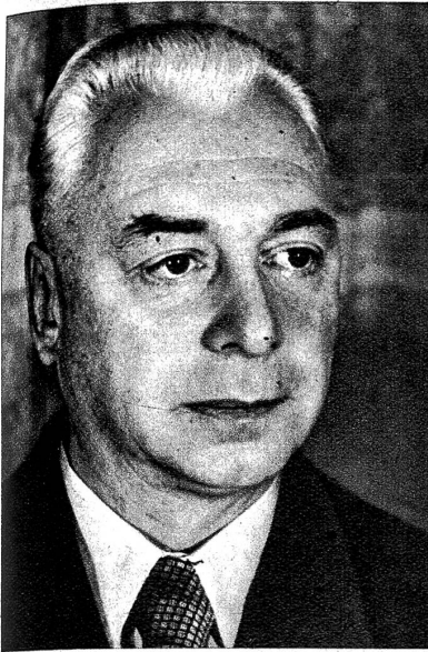
Dr. phil. et Dr. med. vet. h. c.