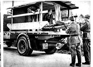
Rotkreuz-Kolonnen wurden organisiert und in beträchtlichem Mass ausgerüstet und die Mannschaft für Dienstleistungen ausgebildet. (III Lg 9137, III Lg 9138)