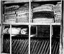
Das Schweiz. Rote Kreuz braucht beständig neues Material, es ständig ergänzt und vermehrt werden, wie zum Beispiel Bettstr., zusammenlegbare Tragbahnen, Wäsche. (III Lg 9139)