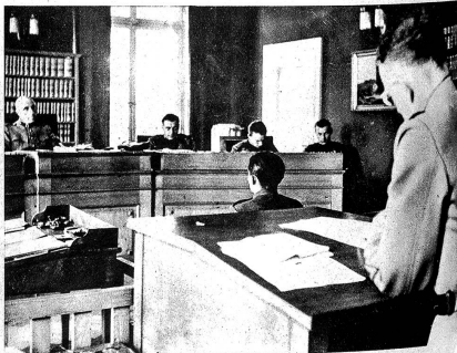
Unten: Der Grossrichter instruiert den Fall. Der Angeklagte gibt Auskunft und kann sich rechtfertigen. Gewissenhaft folgen die Richter den Verhandlungen. Sie alle kennen die Bedürfnisse und Nöte der Truppe.

Unabhängigkeit gegen Aussen und Ordnung im Innern sind die Grundlagen der Eidgenossenschaft. Die Armee ist das Machtmittel, sie zu erhalten, so heisst es im Dienstreglement. Die Armee gehört demzufolge zum Fundament unseres Staates. Ihre Aufgabe kann sie aber nur erfüllen, wenn in ihr Zucht und Ordnung herrscht. Die Scharfaffung und Erhaltung der Disziplin ist in erster Linie Sache der Vorgesetzten. Darüber hinaus dient dem gleichen Zweck auch die Militärgerichtsbarkeit .