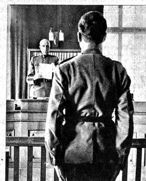
Das Urteil ist gefunden. In guter Haltung nimmt es der Angeklagte entgegen. Er ist Soldat. Er hört auch auf die ermahnenden und aufrichtigen Worte des Grossrichters, die ihn auf den richtigen Weg zurückweisen