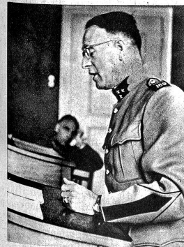
Der Verteidiger hat das Wort. Bezeichnet der Angeklagte selbst keinen Verteidiger, so ernannt der Grossrichter einen solchen. Jeder rechtskundige Offizier der Division ist verpflichtet, die Verteidigung zu übernehmen

Obwohl die Verhandlungen der Militärgerichte in der Regel öffentlich sind, dringt eigentlich sehr wenig über die Tätigkeit dieser Gerichte an die Öffentlichkeit, so dass vielfach unter der Zivilbevölkerung — und zum Teil unter den Soldaten selbst — oft eine ganz falsche Vorstellung über die Zusammensetzung und Arbeitsweise dieser Gerichte vorhanden sind. Auch hier, wie bei