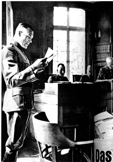
Die Verhandlungen, welche vom Grossrichter, einem Justizoffizier, präsident werden, sind eröffnet. Der Gerichtsschreiber, ebenfalls ein Justizoffizier, verliest die vom Auditor verfasste Anklageschrift. Sie umschreibt in kurzen Zügen die dem Angeklagten zur Last gelegte Tat und bildet die Grundlage der weiteren Verhandlung.