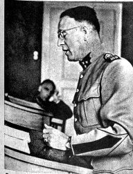
Der Verteidiger hat das Wort. Bezeichnet der Angeklagte selbst keinen Verteidiger, so ernennt der Grossrichter einen solchen. Jeder rechtskundige Offizier der Division ist verpflichtet, die Verteidigung zu übernehmen.

Obwohl die Verhandlungen der Militärgerichte in der Regel öffentlich sind, dringt eigentlich sehr wenig über die Tätigkeit dieser Gerichte an die Öffentlichkeit, so dass vielfach unter der Zivilbevölkerung — und zum Teil unter den Soldaten selbst — oft eine ganz falsche Vorstellung über die Zusammensetzung und Arbeitsweise dieser Gerichte vorhanden sind. Auch hier, wie bei