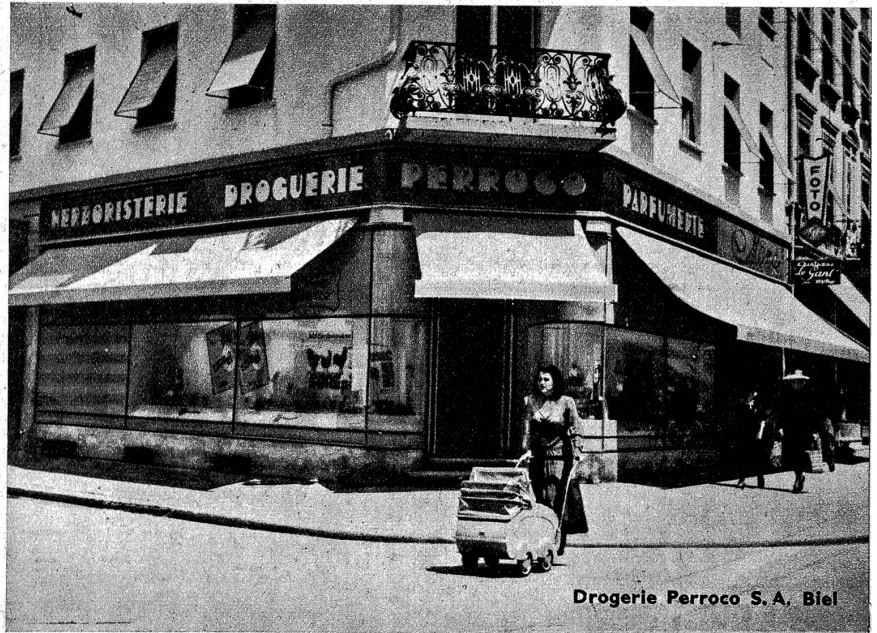
Droguerie Perroco S. A. Biel

Dass Felix Saltens Tierbücher beim schweizerischen Lesepublikum starken Widerhall gefunden haben, wird niemand wundernehmen, denn jeder Tierfreund wird von dem Zauber, der den Büchern