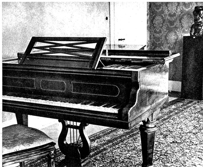
Oben: Originalmanuskripte des Künstlers — Rechts: Richard Wagners Flügel in Tribtschen — Rechts unten: Diese am Hause in Tribtschen angebrachte Tafel erzählt vom emsigen Schaffen des Künstlers

fiel für die grosse Welt vollständig der Vergessenheit anheim. Es sollte aber anders werden. Die Stadt Luzern hielt es für ihre Pflicht, Tribtschen als Kulturgut neu zu erwecken und der Öffentlichkeit zugänglich zu machen. Für den Preis von Fr. 350 000.— kaufte im Jahre 1932 die Stadt das 13 Hektaren haltende Am Rhynsche Fideikommissgut, um es dauernd vor Bebauung und Verschandelung zu schützen. Das Landhaus, in dem Richard Wagner wohnte, wurde mit einem weiteren Kostenaufwand von Fr. 150 000.— restauriert und zu einem bescheidenen, aber intimen Museum umgewandelt. Opferfreudige und kunstsinige Bürger der Stadt halfen mit, die Reichtümer zu beschaffen, deren ein Museum bedarf. So gelang der Ankauf der Partiturschrift des «Siegfried-Idylls», das unter Wagners Leitung 1870 in Tribtschen zu Cosimas Geburtstag zum erstenmal aufgeführt wurde. Den Sympathien des Wagnerschen Hauses Bayreuth verdankt das Museum u. a. den Erard-Flügel als Leihgabe, auf dem Wagner in Tribtschen täglich gespielt hat und der ihn auf vielen Reisen begleitete. Eine weitere Zierde bildet die Originalpartitur des «Schusterliedes» aus den Meistersingern. Die Original Totenmaske, nach dem im Jahre 1883 in Venedig erfolgten Tode des Meisters hergestellt, konnte ebenfalls erworben werden. Dazu kommt eine schöne Zahl wertvoller, aufschlussreicher Originalbriefe, Bildnisse usw., die alle das Museum sehenswert machen.