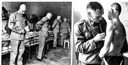
«Jede vor sie Nacht!» hat der Korporal gerufen und jetzt kontrolliert er die Hosenlängen, Schnalle mehr anziehen — Höher diese Hosen, und jene tiefer. Es ist alles nach sehr gabig am ersten Tag, die Rekruten und das viele Zeug aus Tuch und Leder, das sie fortan zu tragen und zu pflegen haben Zens. Nr. 16381