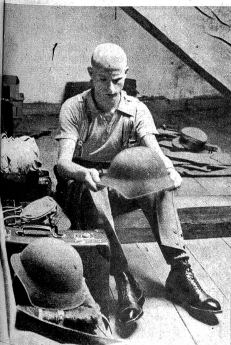
Mediation! Zens. Nr. 16373

Am frühen Nachmittag sind so ziemlich alle zivilen Aspekte vom Kasernenhof verschwunden. Die Neuingekleideten besinnen sich nochmals und werden nun in Kompanien und Züge eingeteilt. Zum erstenmal steht vor den Rekruten ihr Zugführer. Ein gegenseitiges Werweisen und Einschätzen hebt an. Prüfend überblickt der Leutnant seinen Zug, fragend hängen die Blicke der Rekruten am Leutnant. Scheuweis und ihre Wonne kaum verbergend, mit Notizbüchlein hantierend, murmeln die Korporale ihre Gruppen. Die Familien der Armee sind gebildet, der Weg ins militärische Leben nimmt seinen Anfang. Ofr. Th. F.