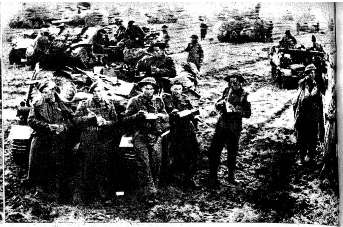
Mit ihren Kleintanks haben sich einige Angehörige der alliierten Luftlandarmee in Holland zur Landarmee durchschlagen können

gelte. Alsdann sei der deutsche Sieg sicher, und der Rest des Krieges gliche einer kurzen, heitern Jagd, verglichen mit der furchtbaren Arbeit von Jahren... seit Stalingrad.