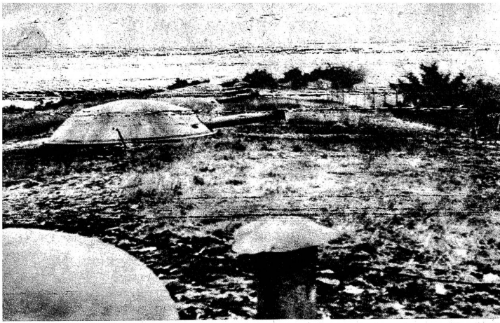
Eine Ironie des Krieges vermittelt uns dieses Funkbild. Die Deutschen umgingen 1940 die Maginotlinie, um dann die Geschütze durch eigene zu ersetzen. Jetzt feuern die Alliierten mit Krupp-Kanonen und erbeuteter deutscher Munition gegen Deutschland