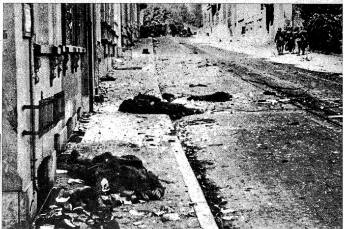
Der Kampf um Arnheim. Haus für Haus musste von den Deutschen erkämpft werden. Die tapferen Fallschirmsoldaten liessen grosse Opfer an Menschen zurück

Links: Die erste alliierte Luftlande-Armee General Brereton's in Holland ist in eine äusserst kritische Situation geraten, nachdem es den Deutschen gelang, den Korridor, der die Verbindung mit den Landarmeen herstellte, zu durchstossen. Verstärkungen durch Fallschirmtruppen vermochten die äusserst heikle Situation noch zu retten