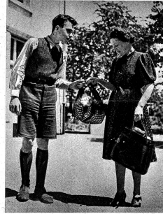
Auf dem Schulweg und auf ihren Gängen durch die Strassen grüssen die Schüler alle bekannten Leute. Links: Sie tragen der Nachbarin das Marktzeck nach Hause, ziehen den schwerbeladenen Wagen den Rain hinauf, begleiten einen ortsunkundigen Fremden auf den Bahnhof, erweisen ihren Gefährten allerlei Freundschaftsdienste und teilen mit ihnen das Pausenbrot. Sie hüten sich, Wickelspinnere einfach auf die Strasse zu werfen, vielmehr tragen sie solche Abfälle zum nächsten Kehrichteimer.

Das Schwerste, aber zugleich das Wichtigste ist das Dienen. Es gilt, immer Gutes zu tun und Hand anzulegen, wo immer sich Gelegenheit bietet. Restlose Hilfsbereitschaft, gezeigt sich vor allem gegenüber den Eltern. Unaufgefordert nehmen die Kinder der Mutter alle Arbeiten ab, die sie selber erledigen können. Sie bemühen sich um ihre kleinen Geschwister, besorgen die Einkäufe, schaffen überall Ordnung. Die älteren Mädchen helfen der