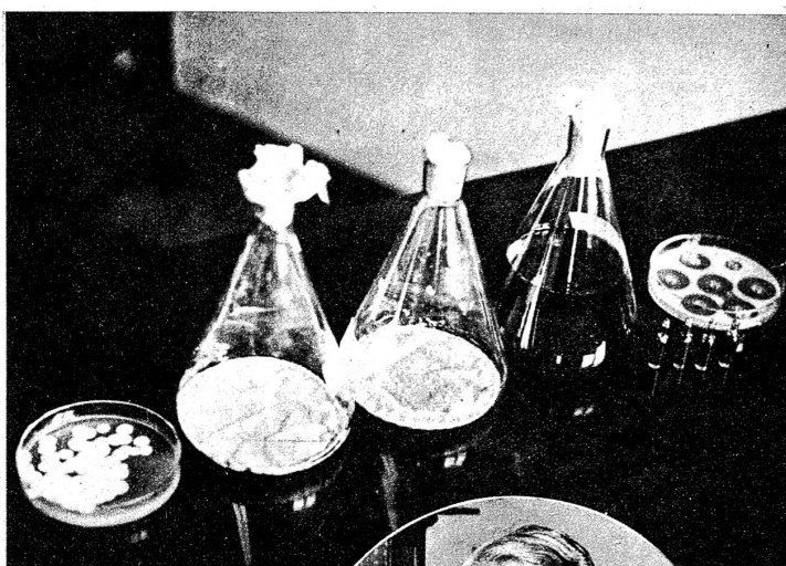
Diese Menge an Penicillin — Schale links — wird monatlich in einer dänischen Fabrik hergestellt. Es sind 200 Gramm, die zur Heilung von 20 Patienten genügen