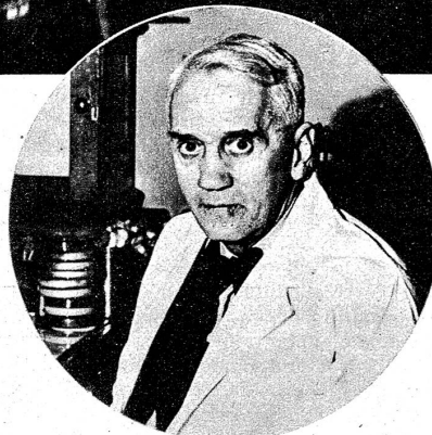
Prof. Dr. Alexander Fleming, der Erfinder des Penicillins, wurde für seine Verdienste vom englischen König in den Adelsstand erhoben. Die Meldung, wonach er den Nobelpreis für Medizin erhalte, hat sich indessen nicht bestätigt