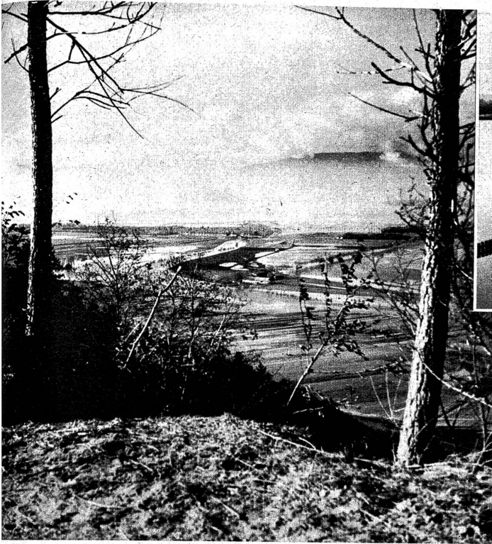
Ausblick vom Vuilly auf das überschwemmte Gebiet