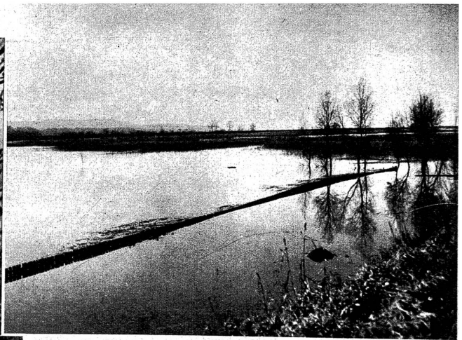
Wie tief das Wasser steht, sieht man am besten an diesem Zaun, der kaum noch sichtbar ist