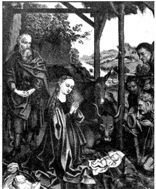
Die Anbetung des „hübschen meister martin“ Martin Schongauer aus dem Jahre 1478

versteinert, manchmal sogar etwas mürrisch, und die Augen haben auf diesen Mosaiken eine auffallend elliptische Form. An den Händen fiel die Dünne und Länge der Finger auf und unter den schwer waldenden Gewändern verschwand die Gestalt jener Madonnen ganz. Erst die Kreuzzüge brachten eine Befreiung von diesen Fesseln, nun begannen die Künstler die Madonna als Inbegriff göttlicher Mütterlichkeit zu sehen und nahmen sich Vorbilder und Modelle aus dem Leben. Der Bildhauer Giovanni Pisano war einer der ersten, der diesen Schritt wagte, ihm folgte Fra Filippo Lippi, Giotto, Mino da Pistoia, Andrea della Robbia, Botticelli, um einige von vielen zu nennen. Reicher und reicher wurden die Madonnen- und Christgeburtbilder, man scheute sich nicht die prunkvollsten Gewänder für die arme Himmelskönigin zu verwenden und die