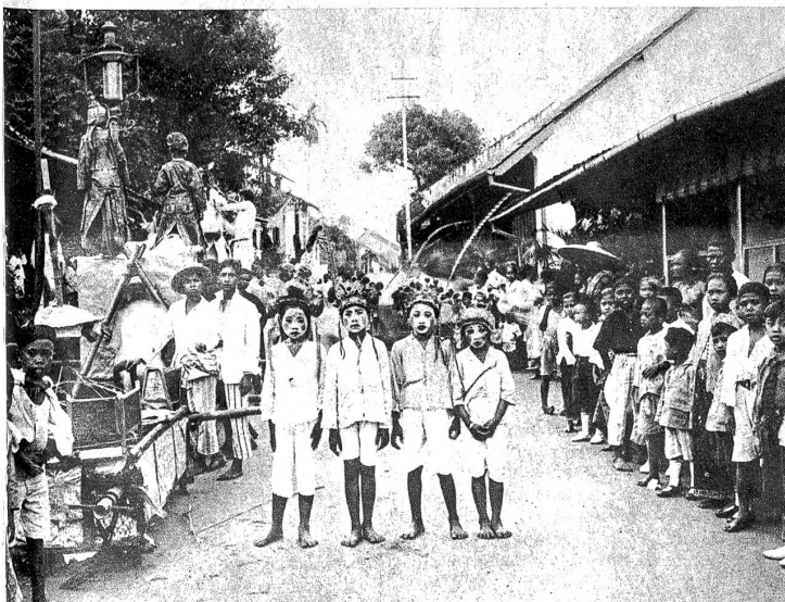
Die Umzugsvorbereitungen sind in vollem Gange. Links Traggestelle für die Djenggehs, wovon zwei bereits fertig montiert. In der Mitte vier als Djenggehs aufgeputzte Knaben mit federgeschmückter Kopfbedeckung aber noch ohne Festgewand. Auch in Niederländisch-Indien sind Feste ein Ereignis für die Jugend. Eine weitere Attraktion ist der Photograph und alles will mit auf die Platte

Ist man dem Infernal entkommen, so fällt es einem wie Schuppen von den Augen. Man fühlt das uralte geheimnisvolle Asien. Viele schon beschrieben es. Aber eines doch konnten sie alle nicht schildern und auch niemand anders: die asiatische Seele.