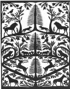
Wie naturverbunden der Künstler war, zeigt vor allem dieser Scherenschnitt mit zahlreichen Tieren aus Feld und Wald