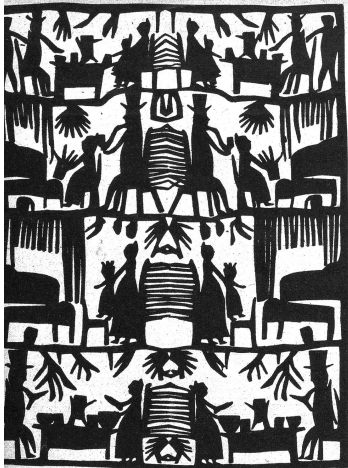
„häusliche Szenen“; mit großer Kunstform wird hier das häusliche Leben dargestellt