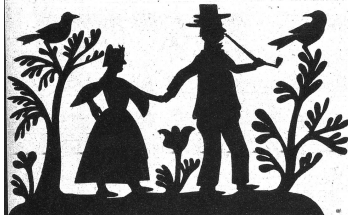
Jeder Scherenschnitt mußte mit ungefalttem Papier hergestellt werden und ist ganz besonders kunstreich in seinem Aufbau