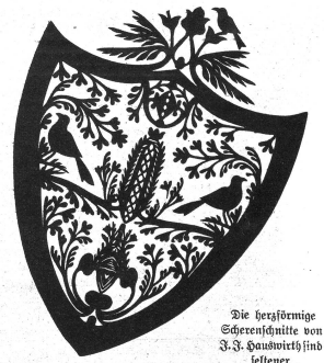
Die herrlichste Scherenschnitte von J. J. Hauswirth sind fetter

Hauswirth hat für seine Scherenschnitte immer Aebener gefunden; aber reich ist er durch seine Kunst nicht geworden. Selbst seine großen Prachtstücke brachten ihm nur wenige Franken ein. Heute gelten sie, wenn sie überhaupt verkauft sind, ein Vielfaches; denn sie werden in aller Welt geschätzt als einzigartige Erzeugnisse echter Volkskunst. R. Marti-Wehren.