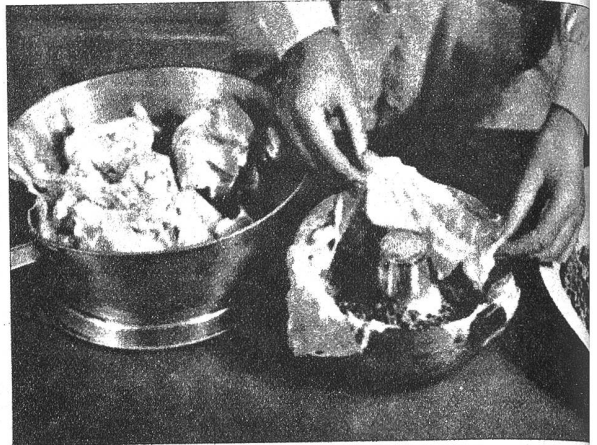
den Pudding im Wasserbad eine reichliche Stunde. Er wird erst gestürzt und mit einer Tomatensauce serviert.

Ein Kohlkopf wird gut gereinigt, in zwei Stücke geschnitten und 10 Minuten im Salzwasser vorgekocht. Dann lässt man ihn abtropfen, löst die grossen Blätter vorsichtig ab und legt damit eine gefettete Puddingform aus. Nun streicht man eine Schicht gehacktes Fleisch oder vom Metzger bezogenes Präg darauf, dann legt man eine Schicht kleinere Blätter darüber, dann wieder Fleisch und Blätter. Zuerst muss Kohl sein. Man schliesst die Form fest und kocht den Pudding im Wasserbad eine reichliche Stunde. Er wird erst gestürzt und mit