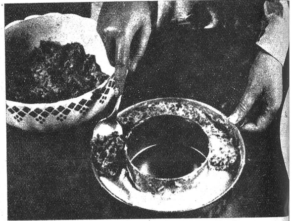
Diesen Kartoffelring serviert man zu Gemüse oder

Aus gekochten und durchgepressten Kartoffeln, dem nötigen Mehl, Salz, Muskat und einem Ei bereitet man eine Masse, von der man die Hälfte in eine gefettete Ringform presst. Darauf gibt man eine dicke Schicht gehacktes und mit einem Ei und Gewürzen verbundenes Fleisch, dann die andere Hälfte der Kartoffelmasse obenauf, deckt mit ein paar Butterflöckchen und Reibkäse zu und bäckt den Ring im Ofen ca. 45 bis 50 Minuten. Diesen Kartoffelring serviert man zu Gemüse oder