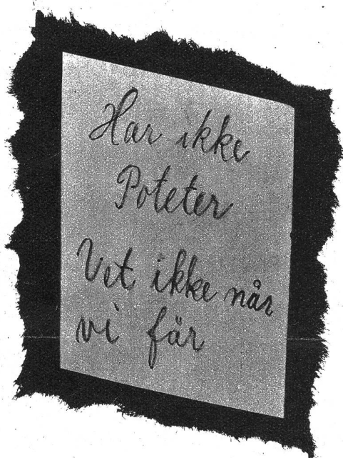
Ein Plakat in Oslo, das deutlich die heutige prekäre Lage charakterisiert: „Keine Kartoffeln mehr, wir wissen nicht, wann es wieder gibt“