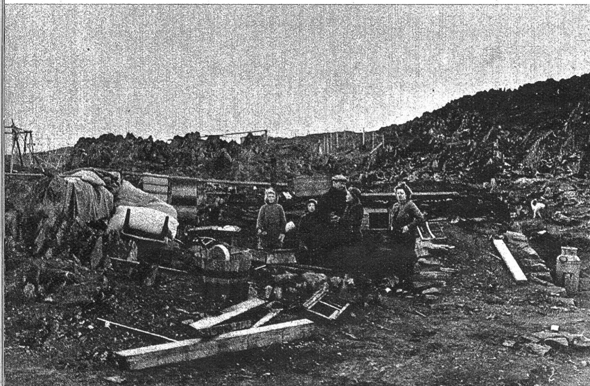
Die Bevölkerung dieses Dorfes in Finnmark, das 460 Einwohner zählte, flüchtete sich beim Vormarsch der Deutschen in die Berge. Jetzt, nach der Befreiung, kehren die Einwohner mit ihren notwendigsten Habseligkeiten zu ihren zerstörten Wohnstätten zurück