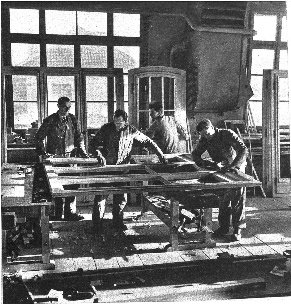
Fertigstellung einer dreiflügeligen Balkontüre