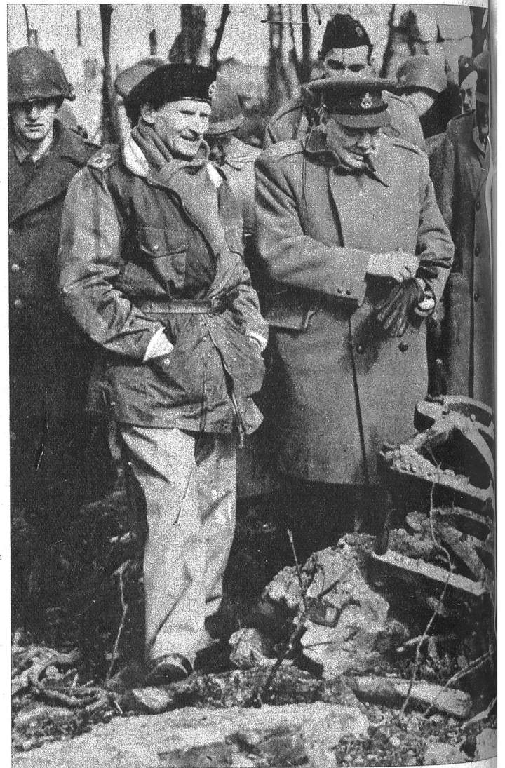
Feldmarschall Montgomery und Ministerpräsident Churchill im Kampfgebiet am Niederrhein