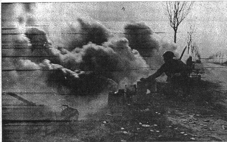
Vernebelung aus Nebelbüchsen am Rheinufer. Ein britischer Infanterist überwacht ihr Funktionieren