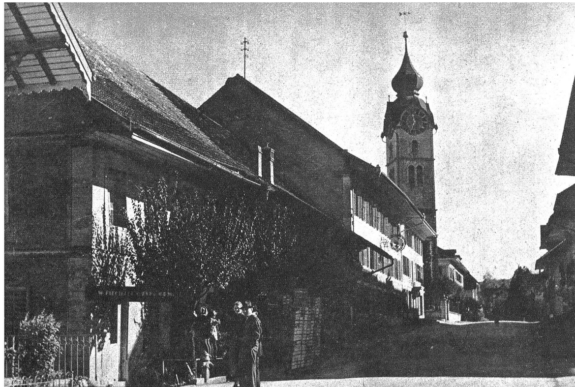
1 Die Markt-gasse in Huttwil mit dem alten bestrenommierten Gasthof zum Mohren auf der linken Seite des Bildes. Vis-à-vis steht das 1933/34 neu erbaute, stilvolle Stadthaus mit sämtlichen Lokalen für die Gemeindeverwaltung. Im Erdgeschoss befindet sich das Restaurant zum Stadthaus, dessen Lokalitäten mit sämtlichen 37 Huttwilerbürgerwappen geschmückt sind