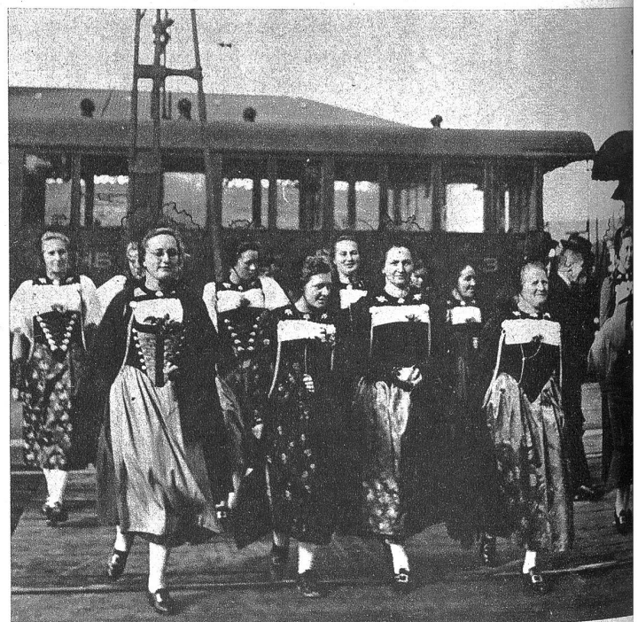
Huttwilerinnen in der schmecken Emmentalertracht. Zum freundlichen, heimeligen Stil des Emmentaler Bauernhauses gehört auch die anmutige Tracht der Frauen. Beides hält die Bevölkerung von Huttwil in hohen Ehren und wird durch die rege Tätigkeit der Trachtengruppe nach Kräften gefördert