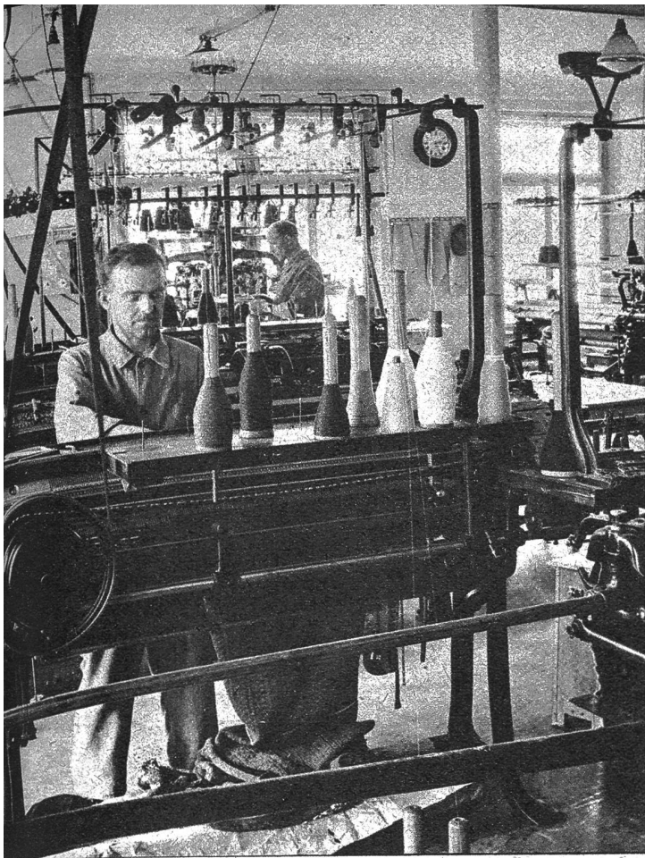
Teilansicht aus einem Maschinensaal