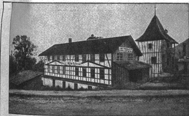
Die Gewürzmühle Kehr Satz

Merke: Jetzt ist auch noch gute Zeit zum Säen der Bohnen, der Gurken, Zuchetti, Cardy und der meisten andern Gemüsearten. Tomaten verpflanzen! G. Roth.