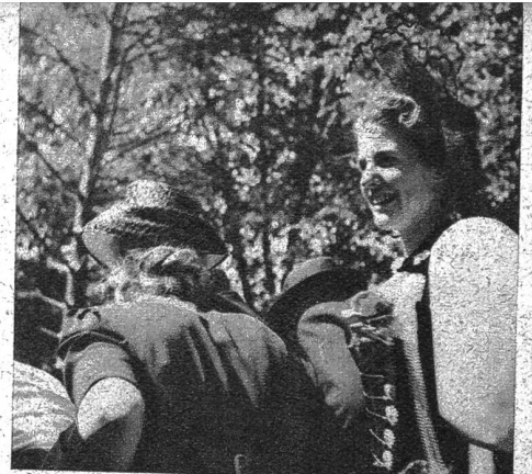
Auch diese schicke Bernerin betrachtet die jungen Bären mit Vergnügen