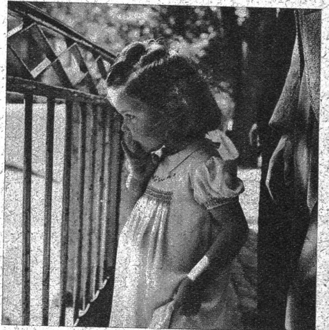
Ganz vertieft schaut diese Kleine den tollen Sprüngen zu

und Not den Kopf über dem Wasser halten kann und schüchtern die ersten Schwimmversuche unternimmt. Es geht häb chläh, aber nun hilft ihm die Mutter wieder hinaus, packt es mit der Schnauze am schmucken, weissen Krägelchen, hilft mit den schweren, breiten Tatzen nach, und nun sitzt das Kleine wieder an der Sonne; pudelnass zwar und ohne grosse Begeisterung für das unwillkommene Bad.