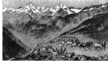
Mit solchen Wagen, die den Blick frei liessen, wurde in früheren Zeiten über den Furkpass gefahren