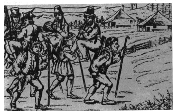
Illustration zu der Geschichte „Die reisenden Musiker“ im Zürcherkalender 1837