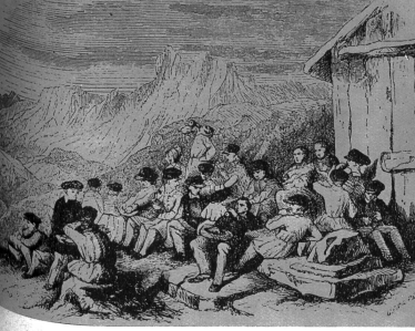
Links: Rast auf der Bergskuppe in der Biedermeierzeit. Zeichnung von Rodolphe Toepffer Rechts: Schweizer Reise während der Biedermeierzeit. Nach einer Zeichnung des Genfer Künstlers Rodolphe Toepffer

Bevor es geschaffen gab, waren die einzigen möglichen als die wirklichen Fremden, die den Pflanzdelweid Aufnahme zeigt die Reisenden auf Verlangen gezeigt