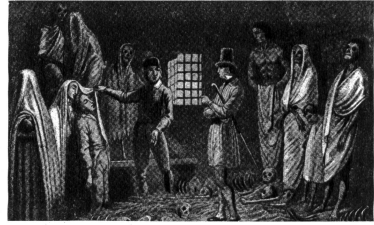
Rechts: Die von den Mönchen des Grossen St. Bernhardshospizes aufgefundenen, erfrorenen Wanderer wurden in der neben dem Hospiz befindlichen Totenkammer zur Identifizierung ausgestellt und den Reisenden auf Verlangen gezeigt (Aquatintastich um 1840)