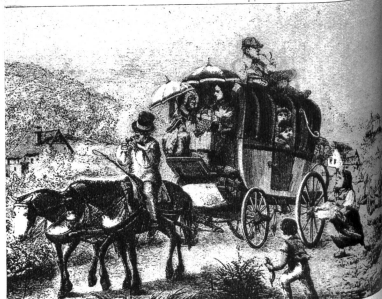
In der Lohnkutsche von Zürich nach dem Bäderstädtchen Baden reiste man langsamer, aber nicht etwa gemütlicher (Zeichnung von Joh. Salomon)