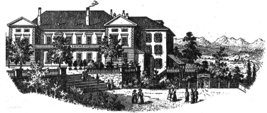
Das alte Casino in Bern, das ungefähr am Platze des heutigen Bundeshauses (Mittelbau) stand, wurde im Jahre 1820 erbaut und 1895 abgerissen

Die Schweiz, eine Perle unter den gesegneten Landschaften Europas, am Fusse der Alpen, gilt als das klassische Land der Fremdenindustrie, als Ferien- und Reiseland par excellence. Diese natürliche Lage im Herzen Europas, die Vorgelege der Alpenpässe, der grossen Nord-Süd-Verbindungen, haben der Schweiz seit alters her den Charakter eines Gastlandes gegeben und deren Bewohner gezwungen sich mit den durchziehenden Fremden zu befassen. Karawanen und Pilgerzüge, Karawanen von Handelsleuten, wandelnde Handwerker zogen in ununterbrochener Folge durch das Land, suchten hier in Herbergen und Gasthäusern Unter-