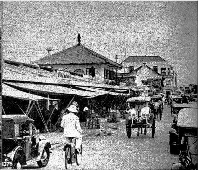
Niederländisch-Indien hat Japans Machtposition nach relativ kleinem Aufwand gewaltig gehoben, und erst auf Kriegsende hin konnten die Australier auf Borneo eindringen. Unser Bild zeigt Batavia (Java)