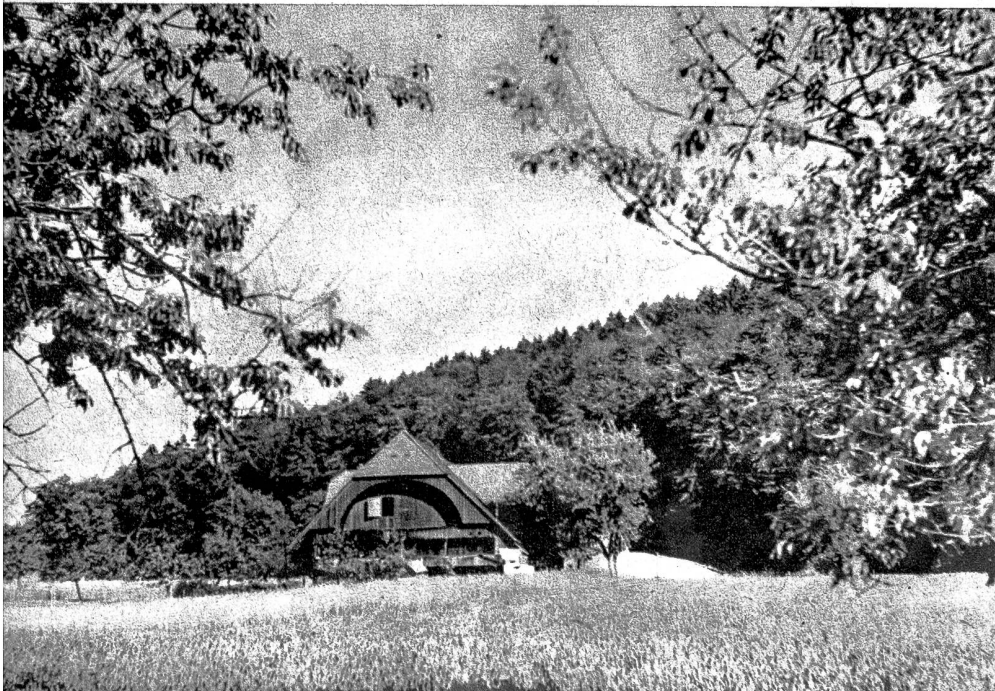
Ein schönes „Heimet“ am Bantiger

Der Menschenschlag am Bantiger ist verschieden, je nach der Lage, wo er wohnt und je nachdem, womit er sich beschäftigt. Am Fuss des Berges haben sich schon vor sehr langer Zeit Industrien angesiedelt. Die erste Papiermühle im Kanton Bern war in Worblafen, jenem Weiler, wo der weltberühmte «Katzen-Raffael» Gottfriedli Mind vor hundert Jahren beheimatet war. Karton- und Zelluloidfabriken und Mühlen finden sich noch heute im Tal der Worblen neben Hammerschmieden, Ziegeleien, Feuerspritzen-Werkstätten und anderen Betrieben. Hier lebt eine rührige Arbeiterbevölkerung, und die ehemaligen äusseren Weiler der Gemeinde Bolligen haben sich zu an-