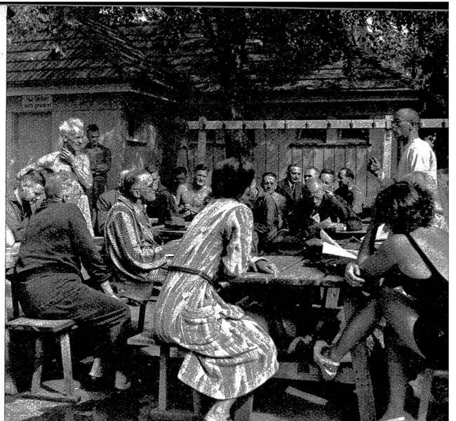
D'Lehrerschaft wird vom Obma vo däm Wettschwimme no einisch orientiert