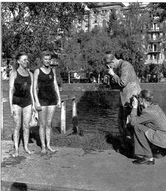
Zwöi vo dene Guldflischligwinner-Anwärterinne wärde verewiget