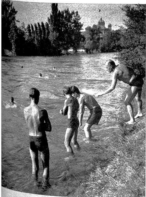
Dr Start vo de Buebe