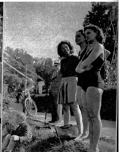
Schad isch gsi, dass i scho cha schwimme denn i hätt mi gärn vo dene drei Schwimmelehrere la belehre