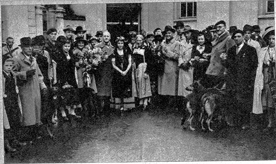
Ankunft der Gäste aus dem Elsass anlässlich der 1. Schweiz. Diensthunde-Ausstellung in Bern