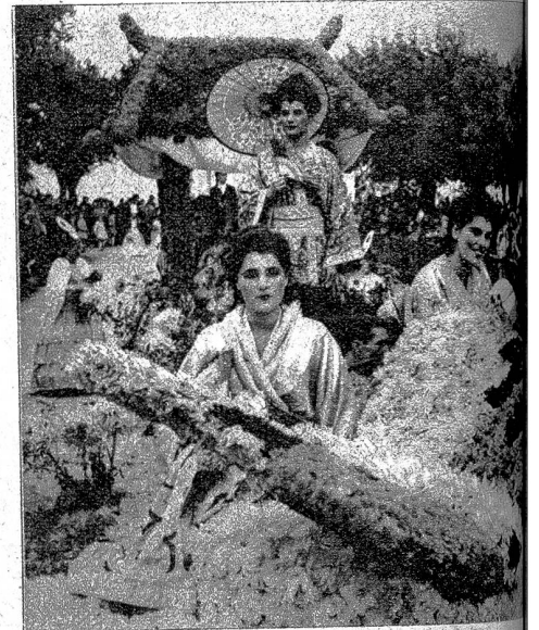
Rechts: Erstmals nach sechs langen Kriegsjahren ist in Neuenburg wieder das Fest der Weinlese durchgeführt worden, das denn auch ganz im Zeichen des Friedensstandes. Aus dem grossen Winzerzug haben wir den eindrucksvollen Blumenwagen „Madame Butterfly“ festgehalten