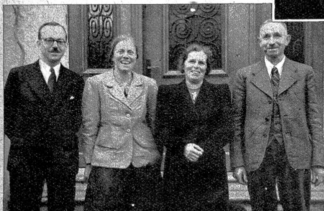
Die elegante Stadtdame und die einfache Frau vom Lande — einst sassen sie einträchtig in der gleichen Bank

man lachte und freute sich ob der wiedergefundenen Jugend. Und als der letzte Zug auch die Sesshaftesten wieder ins Tal zurückführte, sah man lauter glückliche Gesichter, jugendhafte Menschen «in den besten Jahren», die sich schworen, keine 30 Jahre mehr bis zur nächsten Zusammenkunft zu warten. Und wenn sie sich vielleicht auch nicht mehr sehen werden, so wird doch die frischgeweckte Erinnerung haften bleiben und manche Gelegenheit zu stillem Schmunzeln und heimlicher Freude geben.