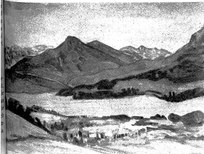
Am Vierwaldstättersee