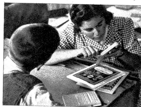
Oben: Auch Lehrerinnen zeigen bei dieser Handarbeit viel Geschick. Die Seitenwand einer Kassele wird beschnitten. Vor dem Schüler ein Brett mit Probeschneiden. Rechts: Der Lehrer einer Gesamtschule am Fusse des Stockhorns übt sich im Beschnitten einer Schulschachtel, während ein weiterer Lehrer einen Glasunteratz in Bearbeitung hat