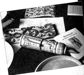
Die Schulschachtel wird mit einem alten Stübliemotiv beschnitten. Links: Student fertige Werke der Kursteilnehmer. Ein kunstvoll eingeschnitztes Alpstock, ein neues Rasgeschirr aus dem Jahre 1736, ein Kerbschnitt ganz links eine über Schiebelschachtel und im Vordergrund Literatur über Volkskunst im Berner Land