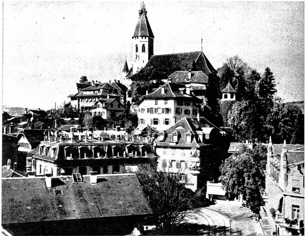
Da in Thun ein guter Konzertsaal fehlt, finden alle grösseren Konzerte in der Kirche statt

Es war nicht zu verwundern, dass die Erfolge der Oetiker-Vereine beim Männer- und Gemischten Chor eine gewisse Spannung erzeugten. Um ihr zu begegnen, wurde die Initiative zu einer Verschmelzung der beiden gemischten Chöre und der Männerchöre ergriffen. Leider siegten da-