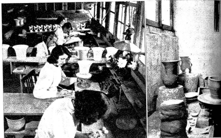
Ansicht des Dekorationsateliers, in dem Künstlerhände der Dekor anbringen