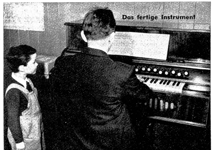
Das fertige Instrument

Aufnahmen aus der Werkstätte H. Otziger, Harmonium- Bau, Glockental-Thun