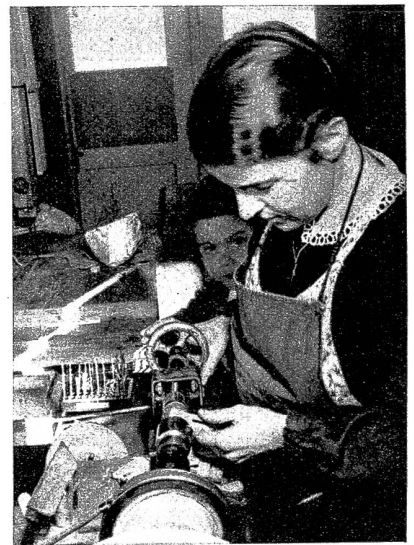
Mechanikteile werden gebohrt

ist als ideales Hausinstrument zu bezeichnen. Erst die jahrelange Benützung zeigt jedoch so recht, ob ein Harmonium Serienfabrikation oder solide Werkmannsarbeit ist. Die Instrumente des H. Otzinger sind anerkannt klangvoll und charakteristisch intoniert , und verfügen über hervorragende Gebläse. Zur Fabrikation der Instrumente wird nur erstklassiges Material verwendet. Jedes Instrument wird mit schriftlicher Garantie abgeliefert.