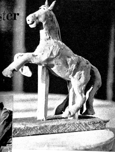
Arbeit eines angehenden Meisters: Die Bewegung