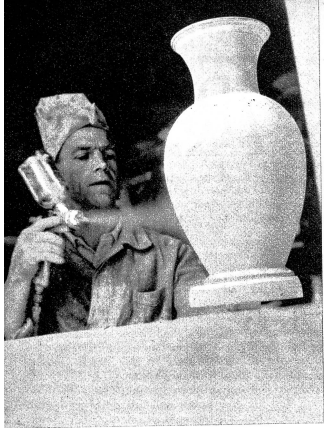
Die edle Form erhält die erste Glasure

ter Schulung und richtiger Führung Formen zu schaffen, die in ihren Ansätzen schon den kommenden Klimate verraten. Das entsprechende Einfühlungsvermögen und der Sinn für die Bewegungen des Lebens geben den Jungen unbewusst Impulse, in denen sich das Geschehene und Gefühlte wieder spiegelt, wenn auch in der Ausführung die Hände nicht immer dem Gestaltungswillen restlos Folge leisten. Aber immerhin, die Form ist und bleibt der kühne Ausdruck des Meisters.