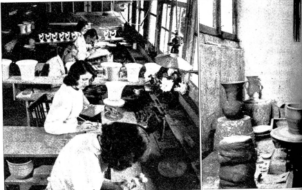
Ansicht des Dekorationsateliers, in dem Künstlerhände der Dekor anbringen