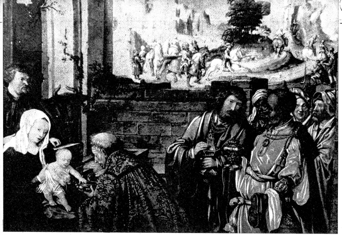
Lucas van Leyden: Anbetung der Könige um 1510