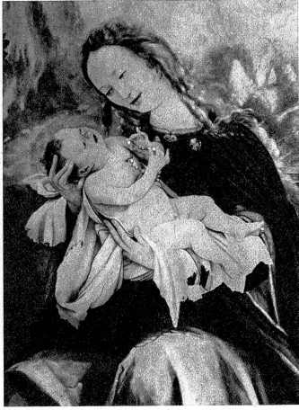
Matthias Grünewald: Mutter Gottes vom Isehnheimer Altar

«Höre mit nei Häre!» het er brüeliet, dass es ihm d'Stimme überschlage het.