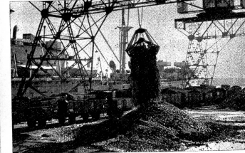
Kohle für die Schweiz! Im Hafen von Genua liegen zurzeit einige Frachtschiffe mit Kohle für die Schweiz und für Oberitalien. Grosse Gleitkrane bringen das schwarze Gold aus dem Schiffsrumpf nach der Güterzugs-Verladeanlage zum Transport nach Norden.