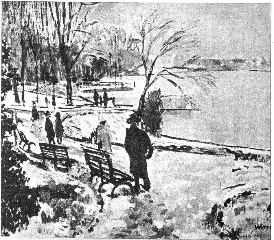
La perle du lac en hiver