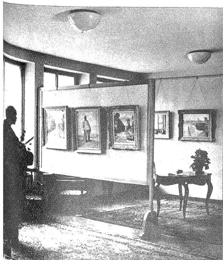
Links: Blick in den Ausstellungs- saal