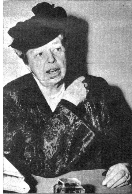
Zweites Bild: Die Witwe des unvergesslichen Präsidenten von Amerika, Frau Eleanor Roosevelt, hat die durch den amerikanischen Senat bestätigte Wahl als Delegierte bei den Vereinten Nationen angenommen, um auf diese Weise das Lebenswerk ihres verstorbenen Gatten fortsetzen zu können