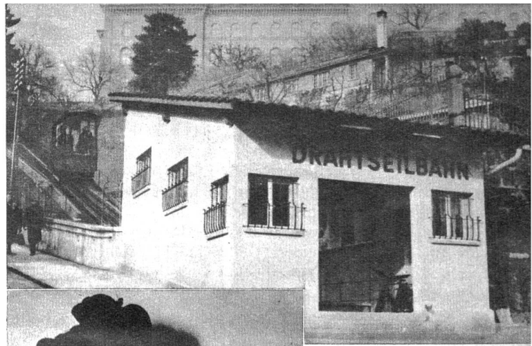
Oben: Die kleinste Drahtseilbahn der Welt, das Marzili-Bähnli in Bern, hat einen neuen „Bahnhof“ erhalten, und zwar an der Talstation. Der Verkehr auf dem Marzili-Bähnli ist 1945 auf mehr als das Doppelte früherer Jahre angewachsen und übersteigt 600 000 Passagiere (ATP)

So sagten die Journalisten. Sie fügten bei, dass sie in acht Tagen wohl zehntausend Toasts auf die alliierte Zusammenarbeit und alles mögliche bringen mussten, ferner, dass sie von den Russen fast zutode gefüttert und getränkt wurden; als eigentliche «Opfer der russischen Gastfreundschaft» wären sie schliesslich völlig erschöpft wieder in Berlin eingetroffen. An diesen Umstand haben natürlich die Zweifler verschiedene Fragen geknüpft, zum Beispiel, wie die Amerikaner in diesem Zustande die peinliche Respektierung der Gewissenhaftigkeit in Sachsen konstatieren konnten. Wir Schweizer werden mit unserm Urteil zurück-