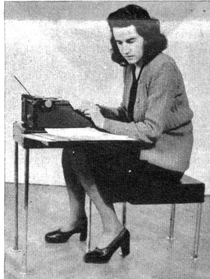
Drittes Bild: Dank einer Erfindung von Paul Ehrlich, dem bekannten Schöpfer der durch Rotes Kreuz und Schweizer Spende ins kriegsgeschädigte Ausland abgegebenen Notzimmergarnitur stellt die schweizerische Aluminiumindustrie jetzt den Schreibmaschinenkoffer der Zukunft her. Dieser, kaum grösser als ein normales Schreibmaschinenkofferchen, lässt sich auf einfachste Weise zu einem praktischen Schreibmaschinentschen mit Auszieher und einem Hocker aufklappen