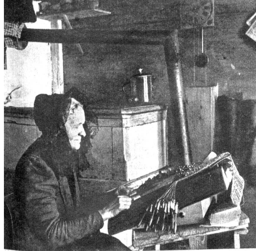
Köpplerin im Lauterbrunnental. Man beachte die alte Spitzenhaube

Zu hinterst im Tale der weissen Lütschine, zwischen dem tosenden Trümmelbach und den hohen Schneebergen und talauswärts auf den von der Jungfrau überragten Höhen bearbeitet es seinen spärlichen Boden. In der Zwischenzeit und besonders im Winter versucht man durch Nebenarbeit die Einnahmen etwas zu steigern. Wie ist dies möglich? Man sucht die Hilfe nicht in der modernen Technik; man greift zurück auf eine entschwundene Zeit, wo im Tale jedem Mädchen zur Konfirmation eine aus Pferdehaar geklöppelte Haube aufgesetzt wurde, man setzt sich wieder ans Klöppelkissen der Gross- und Urgrossmutter und macht Spitzen.