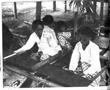
Oben: Auf der Insel Flores werden kostbare Tücher gewoben. Links: Aus wilder Eidechse weben die Alorese an Busser primitiven Webstühlen ihre einfachen Leder...