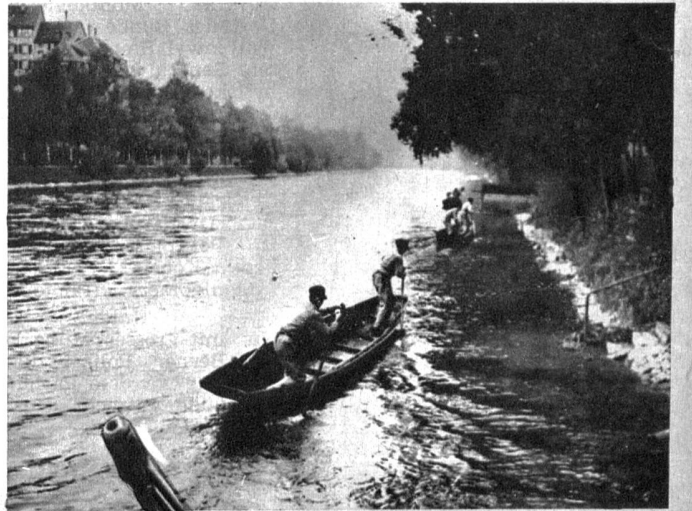
Die Rettung von Verunglückten und die Bergung Ertrunkener fallen ebenfalls in das Aufgabengebiet der Polizei. Das Umgehen mit dem speziellen Flussboot, dem Weidlig, erfordert besondere Uebung sowie Kenntnis der Strömungsgesetze