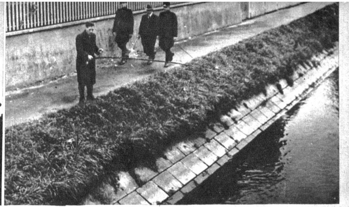
Links: Auch Schreibarbeiten muss der zukünftige Polizist den Reglementen entsprechend erledigen können. — Mitte: Der Hund ist dem Polizisten ein treuer Helfer und folgt seinem Herrn durch dick und dünn. — Rechts: Praktischer Unterricht in der Handhabung der eidgenössischen und kantonalen Polizeigesetze. Hier sehen wir die Polizeirekruten bei der Durchführung einer Kontrolle der Angler am Flussufer. Auch dieser Dienst fällt unter die Aufgaben der Polizei