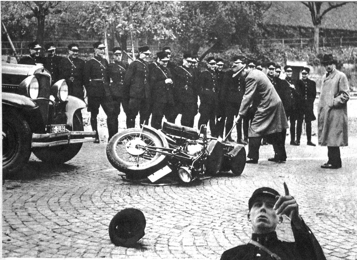
Links: Die Polizeirekruten bei einem rekonstruierten Verkehrsunfall. Der Lehrer zeigt an Hand eines Beispiels wie man die Spuren sicher muss und welche Gesichtspunkte zur Klärung der Schuldfrage massgebend sind.