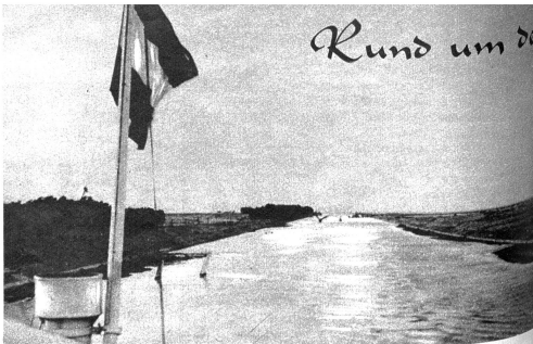
Zwischen endlosen Flächen braunen Wüstensandes gleitet das Schiff durch den Kanal

Der Junge hat sicher recht. Beides ist wahr: die Flasche ist halbvoll, aber auch halbleer gewesen. Ich hatte doppelt recht — die Pessimisten haben meist immer unrecht. Ihre Gesichtspunkte gehen von falschen Voraussetzungen aus. Ich sage zum Beispiel lieber, mein Mann habe eine sehr hohe Stirn als: «Er hat eine schon beginnende und frühzeitige Glatze». Er hat eine wunderbare Stirn. Und ich habe ihn gerade gern mit seiner übermäßig hohen Stirn, die zu ihm gehört. Und seit ich die Probe mit der Flasche bestanden habe, glaube ich doppelt daran, dass es richtig ist, wie ich denke. Der Trick mit der Flasche könnte ja auf unzählige Fragen im Leben angewandt werden, und ich möchte immer auf der rechten Seite stehen. Vielleicht entgegen Sie mir, das sei ein loses Spiel mit Worten. Aber Sie haben unrecht: die Menschen sind und werden so, wie wir mit ihnen umgehen, und was wir aus ihnen machen. Wohin kämen wir mit unserer Liebe, wenn die Flasche immer halbleer wäre? Zum Optimismus gehört die Kraft der Liebe. Sie lässt uns die Flasche halbvoll sehen, wenn sie in Wirklichkeit ebenso halbleer ist. Und wie steht's mit demer, mit Ihrer Flasche...? E.I.