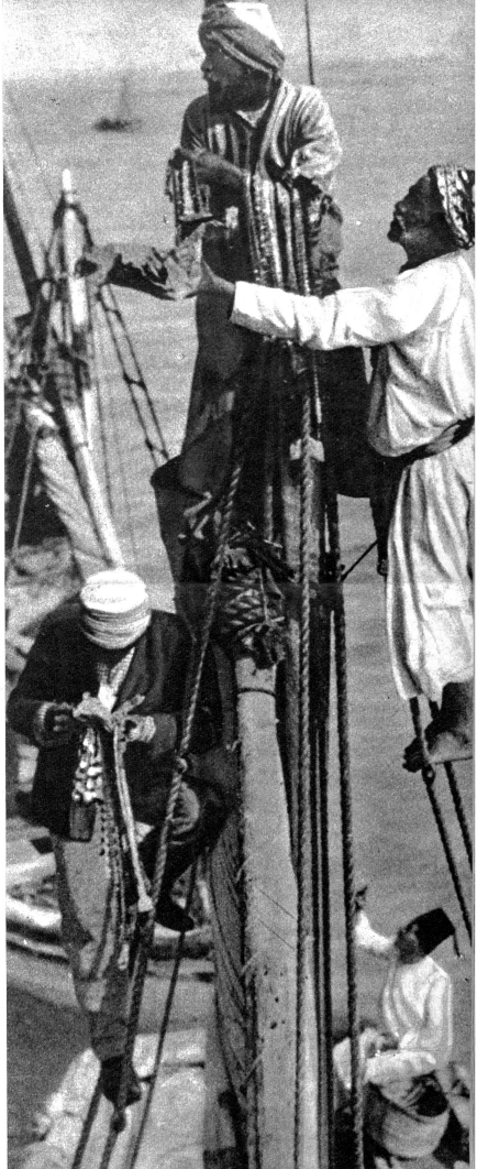
Rechts: Arabische Händler klettern an den Masten ihrer Segelboote an, um ihren Kram auch dann an den Mann zu bringen, wenn das Betreten des Schiffes verboten ist. Links: Selbstbewusst schauen die arabischen Frauen in die Welt, seitdem sie nicht mehr gezwungen sind, unter schwarzen Schleier ihre Schönheit zu verbergen

Drei Tage dauert die Fahrt durch das Rote Meer. Die Reisenden verschlafen die Tage auf ihren Liegestühlen auf Deck, denn die schwere, brütende Wüstenhitze macht jede Bewegung zur Last. Bei Aden öffnet sich die Unendlichkeit des Indischen Ozeans. Die Reisenden erwachen wieder, dem neuen Leben entgegengehend, das sie nach fünf-tägiger Fahrt in Indien erwartet.