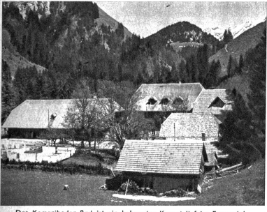
Das Kemmeriboden-Bad ist ein bekannter Kurort tief im Emmental am Fusse des Hohgant