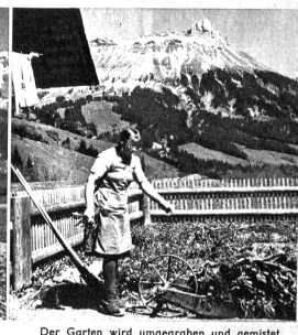
Der Garten wird umgegraben und gemistet im Hintergrund der Schybegütsch