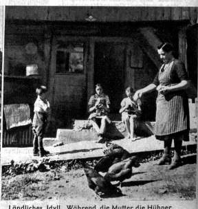
Ländliches Idyll. Während die Mutter die Hühner füttert, sieht man die beiden Töchterchen im Hintergrund, die eine beim Strümpfe flicken, die andere beim Strümpfe stricken