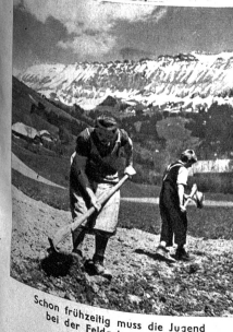
Schon frühzeitig muss die Jugend bei der Feldarbeit mithelfen