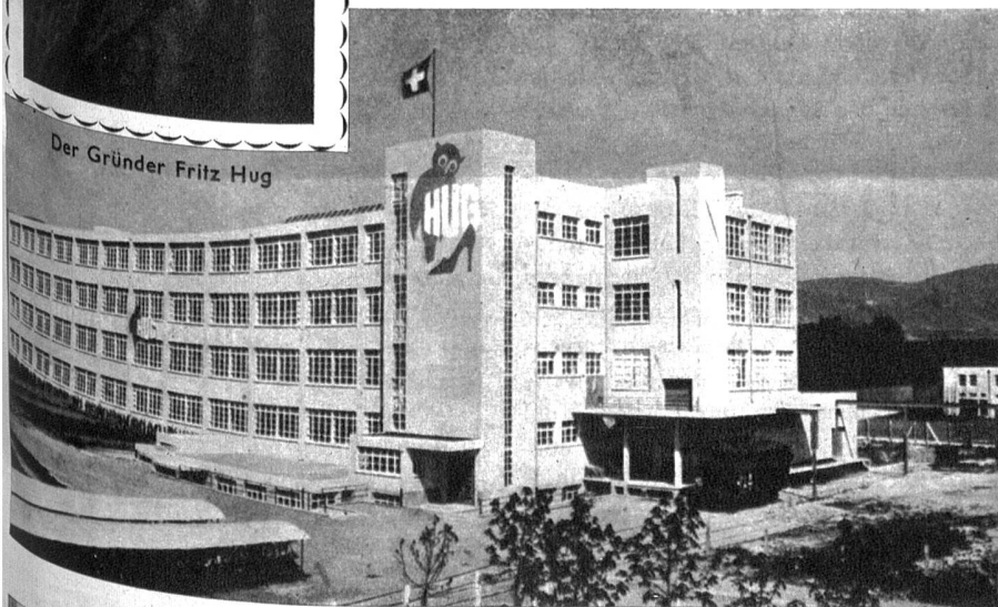
Die Fabrik in Dulliken 1933