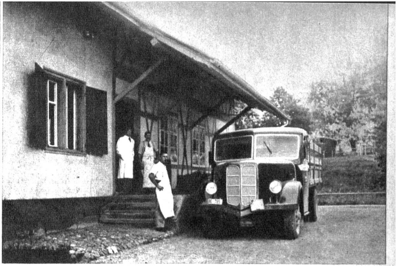
Teilansicht des Lagers in Herzogenbuchsee