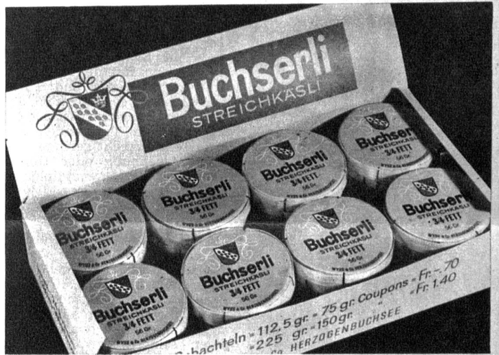
„Buchserli“-Streichkäse der Firma Wyss & Co.