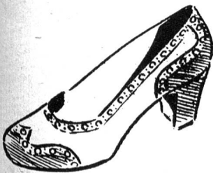
Der „fifty-fifty“ weiss/braun, Frühjahrs-Decolleté

Der jugendlich niedere Absatz bleibt die Regel, wenn es sich um trotteurähnliche Vormittagstypen handelt, während sich