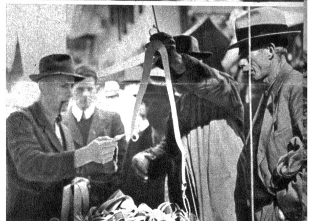
Was, es Fränkli u feuf Batze die Hoseträger? Da ga se gschyder i d'Apithek ga choufe!

Links: Blick auf das rege Marktgetriebe in Saanen