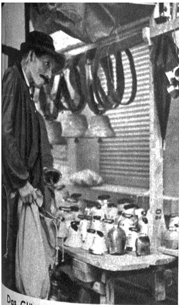
Das Glöggli het es cheibe schöns Glüt, das würd dr Liesi donners guet astah