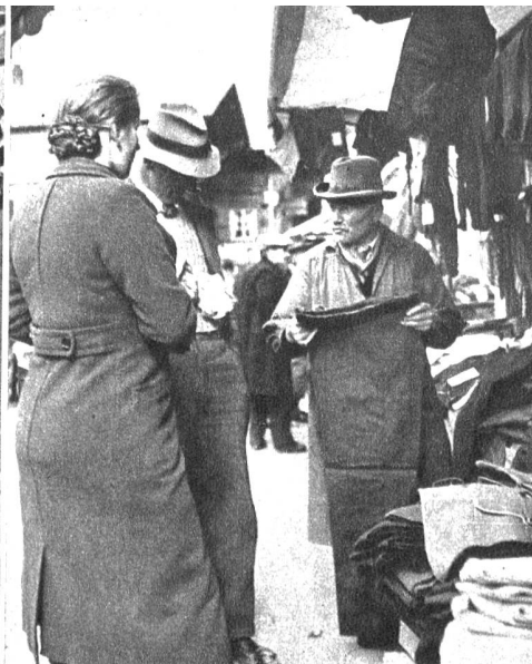
Je ja, neui Hose sött i scho lang ha, aber es bruche nit so chöstligi z'sy, halblinigi tüe's ou