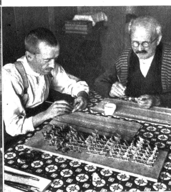
Heimarbeit, Bemalung von Zinnsoldaten