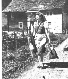
Links: Die Pöstlerin von Gurin

ste Stufe des Pomatt, ist, trotz italienischer Sprachnähe, deutsch geblieben. Die Pomatt der Guriner ist aufs engste mit der Pomatt des oberwälsischen Valtellins verwandt. Trotz ihrer deutschen Zugehörigkeit zum italienischen Sprachgebiet, sprechen die Guriner in der Schule, in der Kirche, in den Unternehmungen mit dem italienischen Verkehrssprache mit dem Tessiner, auch heute sprechen sie unter sich durchwegs deutsch. Die Pomatt Bosco-Gurin eine ausserordentlich interessante sprachliche Merkwürdig-