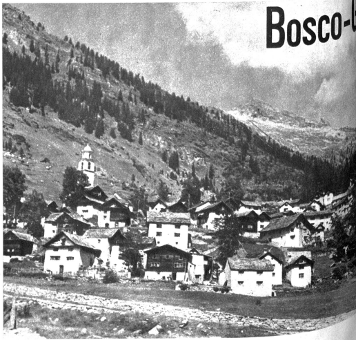
Links: Dorfpartie — Oben: Bosco-Gurin