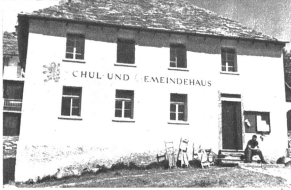
Das Schul- und Gemeindehaus

Die Herkunft der Guriner darf heute als aufgeklärt gelten. Es ist eine Walsersiedlung, wie sich solche am Südfuss der Alpen in grösserer Zahl finden. In den Ostalpen haben sich deutsche Sprachinseln, durch hohe Gebirgskämme vom deutschsprachigen Lande getrennt, mitten in ita-