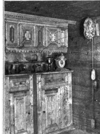
Im Walsershaus, Alte «Stuba» mit «Ganterli»