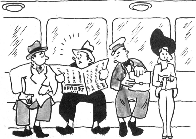
«Haha, ist Ihnen wohl so nicht recht?»