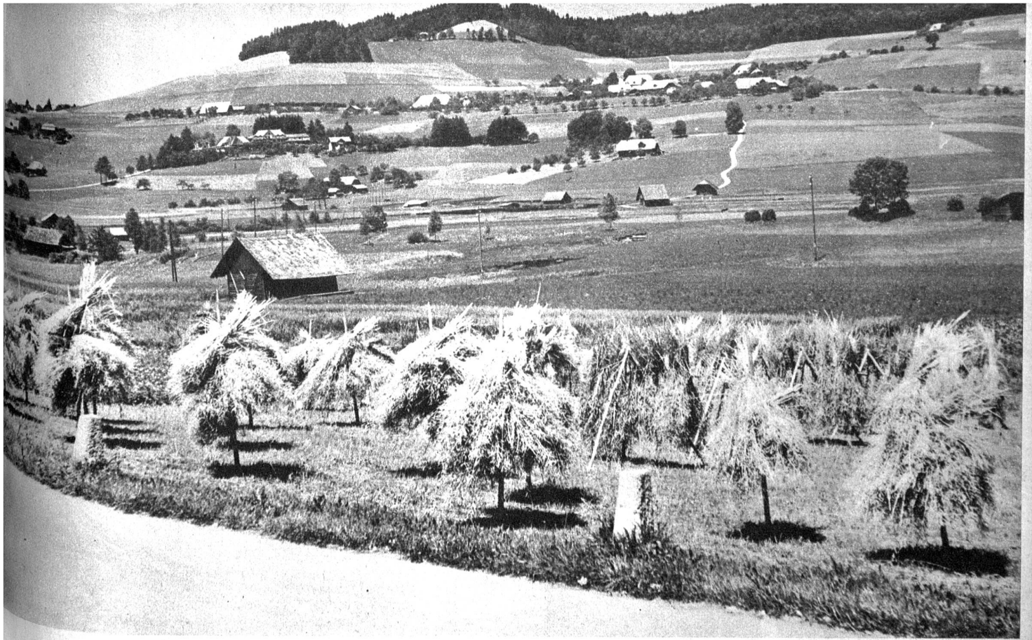
Landschaft gegen Biglen, links im Hintergrund das bekannte Rütihubelbad

volkskundlicher Begriff, es ist zweifellos auch geologisch und orographisch bestimmbar. Und doch lässt es sich nicht mit Begriffen allein einfangen.