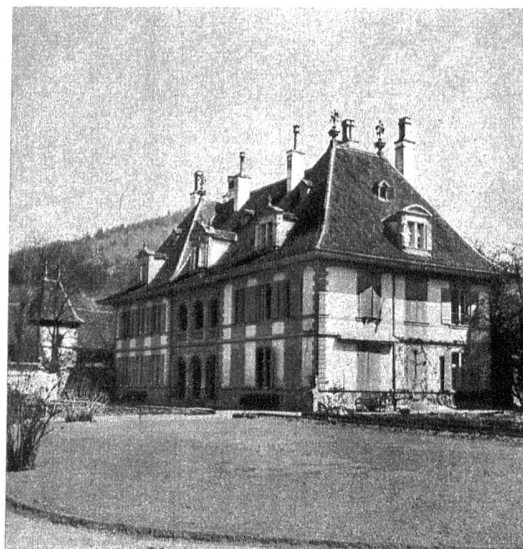
Das neue Schloss entstand in den Jahren 1668 bis 1670