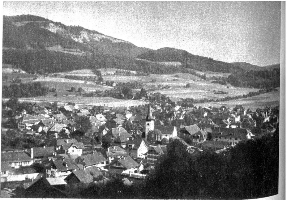
Oberdiessbach mit der Falkenfluh im Hintergrund

Wer ohne vorgefasstes Reiseziel Oberdiessbach als Ausgangspunkt für einen Ausflug wählt, dem wird die Wahl schwer. Er mag blicken nach welcher Himmelsrichtung er will, überall entdeckt er verlockende Ziele. Gute Wegmarkierungen erleichtern die Wanderung, und Ruhebänke an schattigen, aussichtsreichen Punkten laden zum Verweilen und besinnlichen Schauen ein. Scheue die Mühe nicht, du Wanderlustiger, und steige in fünf Viertelstunden hinauf auf die Falkenfluh. Die herrlichste Aussicht auf das Kiesen- und das Aaretal, den Thunersee, die Voralpen und die ewigen Schneegipfel wird dich tausendfach entschädigen. Von der Falkenfluh führt ein bequemer Höhenweg auf dem Rücken des Buchholterberges über die manchem Skifahrer bekannte