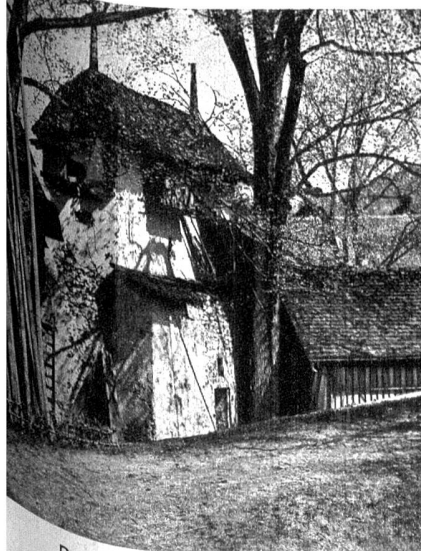
Der malerische Gefängnisturm

Aeschlenalp bis ins Schlegwegbad. Vom Glasholz über den Kurzenberg und den Ringgis wandert man mühelos bis zur altherwürdigen früheren Wallfahrtskirche der Maria in Würzbrunnen.