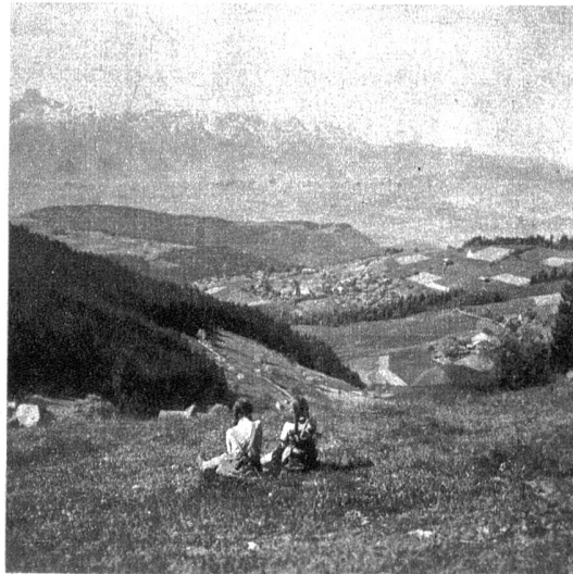
Blick von der Äschlenalp über Bleiken, das Aaretal auf die Stockhornkette